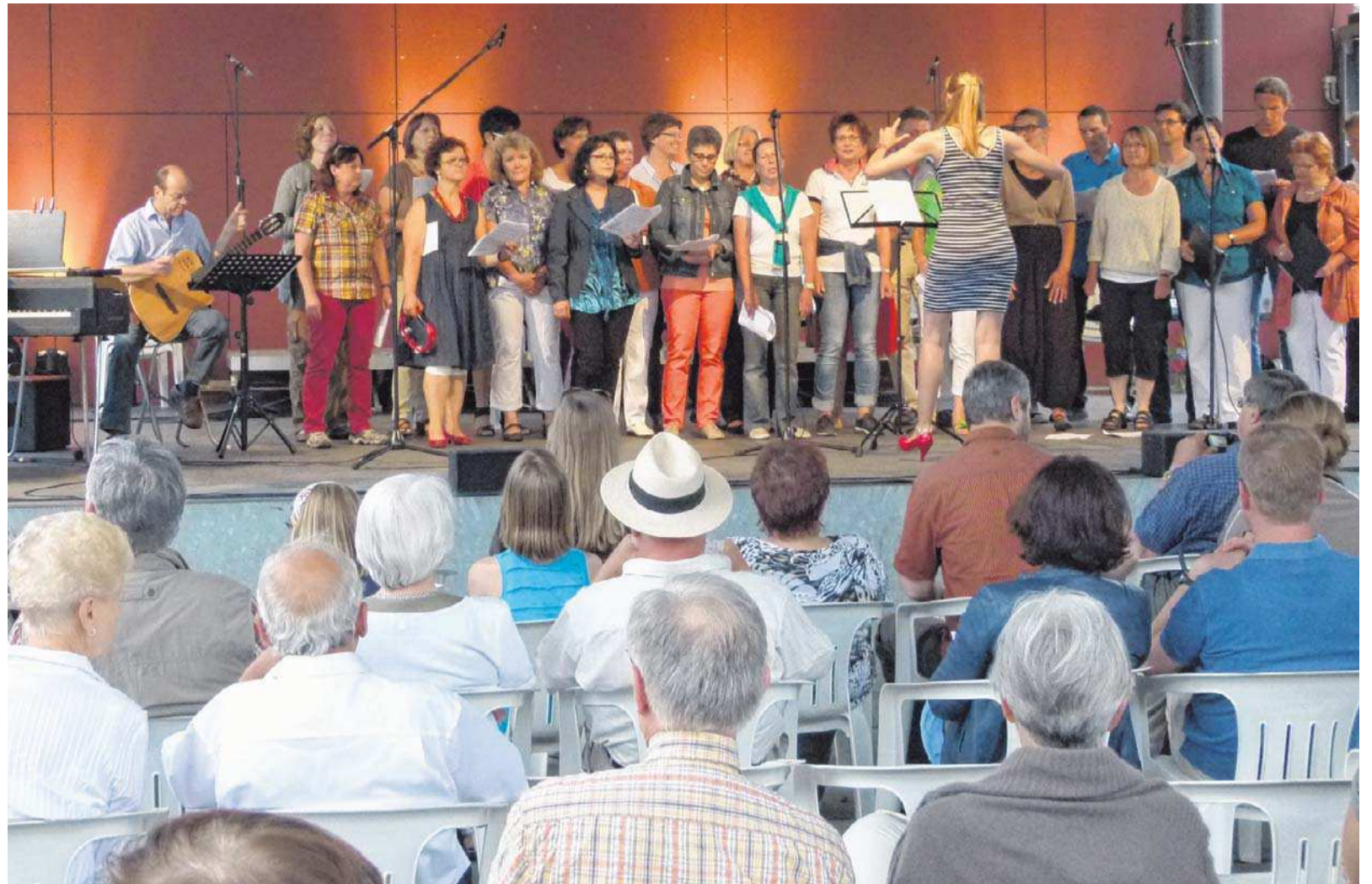
Auch bei der Fête de la Musique dabei: die Gruppe „PONS - die Brückenbauer“ der Seelsorgeeinheit Sankt Maria / Heilig Geist.

Ein kulturell sehr engagiertes Weingartener Ehepaar war von der guten Beteiligung gerade junger